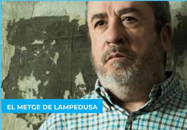
EL METGE DE LAMPEDUSA