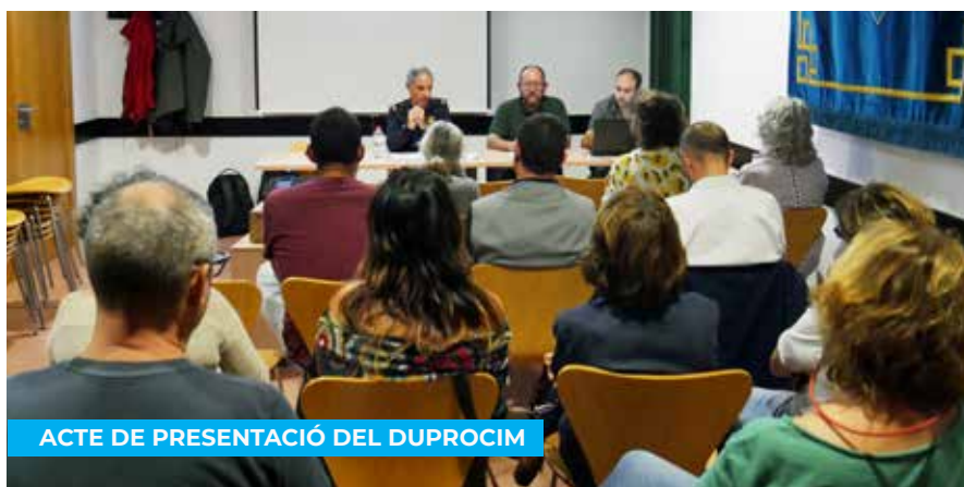
ACTE DE PRESENTACIÓ DEL DUPROCIM

Cal recordar que des de finals de desembre Policia local i Mossos d'Esquadra han reforçat la seva presència a diversos punts de Premià de Mar amb l'objectiu de prevenir delictes i actes incívics arreu del municipi. Aquest reforç es materialitza a les zones més comercials i de moviment de ciutadans les hores diürnes, però també a la nit als punts on s'han detectat actes vandàlics i molèsties causades per sorolls i consum d'alcohol i d'estupefaents. A més, s'estan considerant altres fórmules per a incrementar la seguretat als carrers de la vila, com ara la col·locació de càmeres de vigilància, la ubicació de les quals s'està estudiant. Consells de seguretat dels Mossos d'Esquadra: https://mossos.gencat.cat/ca/consells_de_seguretat/ .