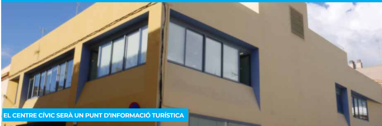
EL CENTRE CÍVIC SERÀ UN PUNT D'INFORMACIÓ TURÍSTICA